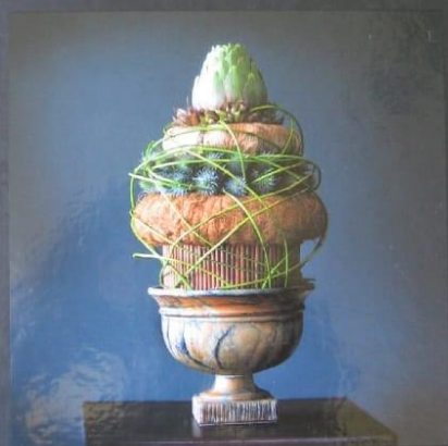
Bloemwerk van Berend Krottje